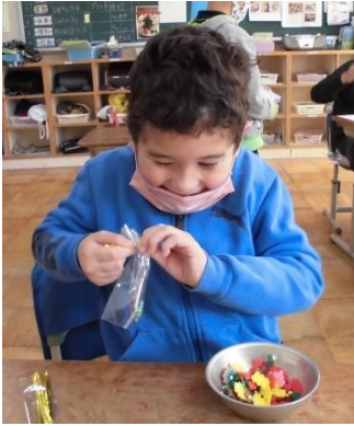
干し柿販売の準備