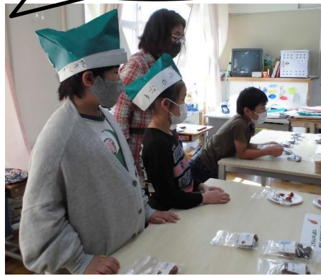
先生方に干し柿を販売