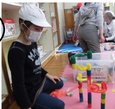
学区探検第2弾 東部児童館