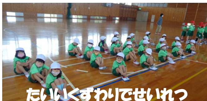
たいいくずわいでせいれつ