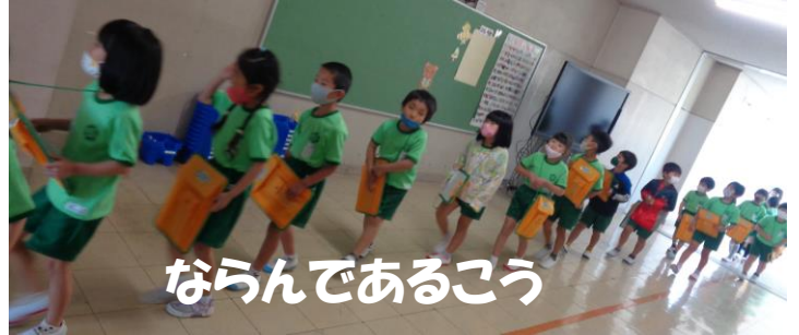
ならんであるこう