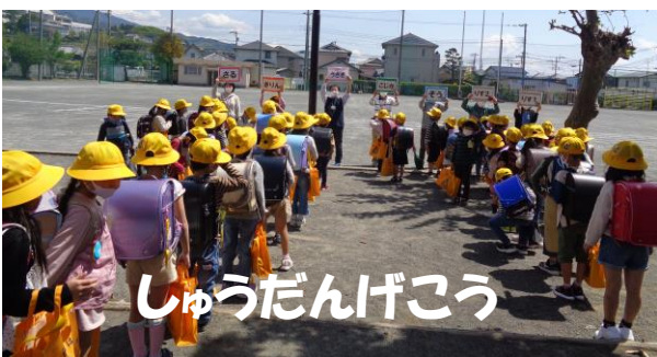
しゅうだんげこう