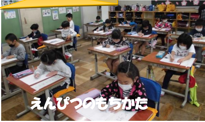
えんぴつのもちかた