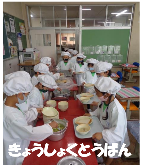
きょうしょくとうぼん