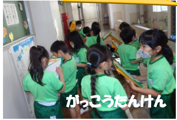
かっこうたんけん