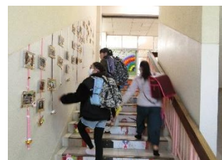
(校舎内の飾りつけ)

コロナ禍のため、学年部毎に取組を考えて、6年生に「大好き」の思いを伝えました。活動に規制はありましたが、その中でできることを計画・運営しました。中心になって計画・運営をしてくれた5年生の皆さん、お疲れ様でした。「段取り八分、仕事二分」という言葉がありますが、5年生の準備の様子を見ていて安心して会を見守ることができました。