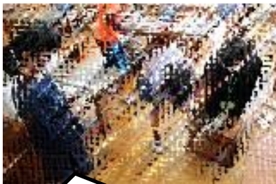
3年生：図工 のこぎりで工作の見守り

また、授業において保護者の皆様にお手伝いいただいている「授業参加」へのご協力をありがとうございます。子どもたちや担任にとっては、図工や地域探検等で、大人の見守りがあり安心できます。これからも、各学年から授業参加の願いがあるかと思いますが、ご協力をお願いいたします。