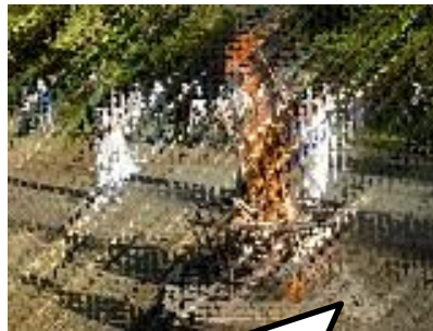
5年生：みどりの学校 キャンプファイヤー