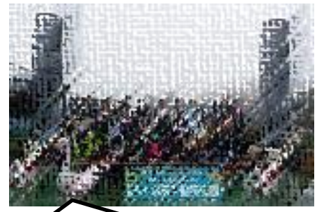
6年生：修学旅行2 自分たちで計画した見学場所へ