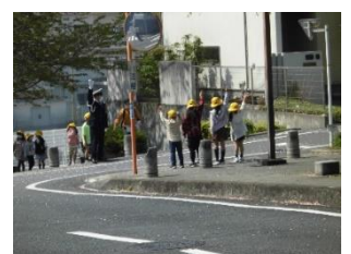
左右前後を確認してから横断