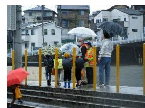
1年生に付き添う見守り隊