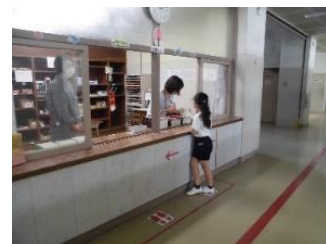
販売時間は10時5分から10時20分

4月19日(火)から、CS購買ボランティア活動がスタートしました。購買は20分休みに開けられ、ノートや名札など学習に必要な道具が販売されます。今年度は新たに2名の保護者がボランティア登録され、5名のボランティアさんが、月曜日から金曜日まで週5日間、日替わりで来てくださり、とてもありがたいです。子供たちとのふれあいを楽しみながら、無理のない活動をよろしく願いいたします。