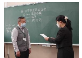
新任の委員へ委嘱状交付