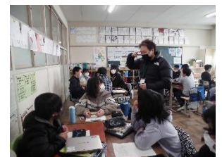
前髪のカットのこつを教わる

子どもたちは、講話を聞いた後、各教室にもどり、職業講話の「振り返り」を行いました。グループに分かれ、自分の聞いた講話の内容を友達に伝え、感想を発表しました。講師のみなさんは、この間も教室を回ってくださり、質問に答えてくださいました。子どもたちのために、お忙しい中ご協力くださりありがとうございました。