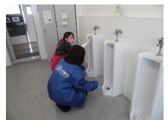
普段手の届かないところを磨きます

CSトイレ清掃ボランティアを募集したところ、6名の方が申し込んでくださいました。1日目は、中学生のお子さんも参加くださり、1時間余りの作業でしたが、17日は北校舎3・4階のトイレを、18日は南校舎1階のトイレを、すみずみまで磨いてくださいました。ご協力ありがとうございました。