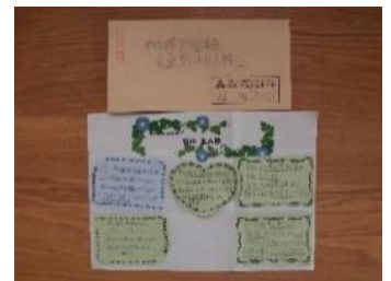
児童から贈られた感謝の手紙

議事ではまず、後期学校評価アンケート結果について報告があり、地域での言葉づかいやあいさつについて、委員に子どもたちの様子を伺いました。「5年生がポスターのことで来店したが、言葉づかいが丁寧で感心した。」「マスクをしていて、誰だか分かりづらいせいもあり、あいさつが減っているようだ。会釈ができるとういと思う。」などの意見が出され、今後の課題も見えてきました。次に、今年度は、延べ人数358名(実人数93名)の皆さんに、CSボランティアとして、学習や学校生活を支援していただき、全学年の学習に、地域の方が関わってくださったことが報告されました。来年度は、さらにCSボランティアの輪を広げるため、支援の内容をわかりやすくした募集用紙を用意し、新たに「CS旗振りボランティア」「CSクラブ活動ボランティア」も募集することになりました。最後に学校長から、令和4年度学校経営方針が示されました。小中一貫教育を見据えて、小中学校で一貫性・連続性のある教育活動を進めていくことや、それを支えるのは家庭、地域との連携であり、まさに、コミュニティ・スクールであることが説明され、広見小が目指す姿を共有することができました。