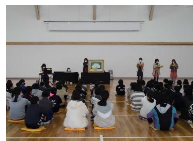
体育館で行われた小学校最後の読み聞かせ

2月4日(金)、CS読み聞かせボランティアのひろみ文庫の皆さんが、巣立ちゆく6年生のために、小学校最後の「読み聞かせ」をしてくださいました。手づくりの大型紙芝居「王さまと九人のきょうだい」が披露され、3名の読み手が気持ちを込めて読んでくださいました。キーボードの演奏が加わり、9人兄弟が悪い王様を打ち負かす痛快な場面が、いっそう盛り上がりました。6年生も静か