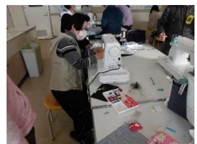
ミシンの糸調子を調整してもらいます

5年生がエプロン製作で初めてミシンを使うため、9名のCSミシンボランティアの皆さんが支援してくださいました。上糸のかけ方や下糸のセットの仕方を確認してもらったり、まっすぐ縫うコツを教えてくださいました。ボランティアさんは子どもたちに引っ張りだこです。また、ミシンだけでなく、縫いしろを三つ折りにし、まち針でとめ、仮縫いをする作業でも、子どもたちの質問に答えながら、丁寧に教えてくださいました。ご支援ありがとうございました。