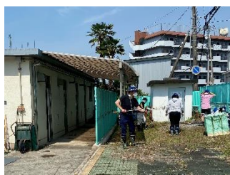
プール敷地内の草取り