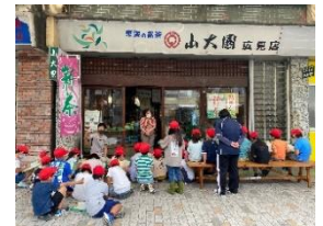
見学の最後に質問コーナー