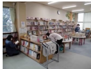
「おすすめの本」の選書

CS学校図書館ボランティアの皆さんは、本の修理や季節に合わせた掲示物の作成、読書環境の整備に取り組んでくださっています。今年度は新たに3名の保護者に登録いただき、10名で活動がスタートしました。第1回目は「あじさい読書月間」に向けて「おすすめの本」の選書や、あじさいの花の掲示などが行われました。