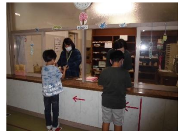
ソーシャルディスタンスでお買い物

今年度は3名のCS購買ボランティアの皆さんが、毎週火・水・金曜日の20分休みに、学用品の販売をお手伝いくださっています。5月に入り新学期の忙しさも一段落しましたが、一人一人の子どもたちを大切に、丁寧に対応いただいています。