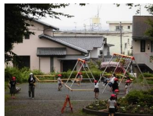
2丁目公園の遊具で遊ぶ