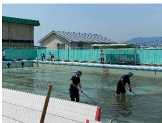
プール内の藻の除去

例年、水泳運動が始まる前に、6年生によるプール清掃が行われるのですが、2年ぶりの清掃になりますので、CSプール清掃ボランティアを募集し、6年生の清掃の下準備を行うことになりました。PTA、学校運営協議会委員、広見子どもクラブ支援員、見守り隊から、16名の皆さんが応募くださり、プール内の藻の除去やプール敷地内の草取りなど、2時間ほど作業していただきました。暑い中ありがとうございました。