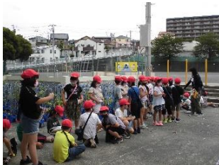
出発前の人数確認

2年生3クラスが生活科「まちが大すき たんけんたい」の校外学習で、小学校～広見郵便局～広見ショッピング商店街～広見町駐在所～広見2丁目公園～小学校の探検へ3コースに分かれて出掛けました。途中、広見郵便局の局員さんが手を振ってくださったり、商店街の开店準備の様子を眺めたりしながら探検しました。2丁目公園で遊ぶ時間もあり、楽しい校外学習になりました。今回は、4月に募集しましたCSボランティアに登録された2名の保護者がCS校外学習ボランティアとしてご協力くださり、クラスの一番後ろに付添い、子どもたちの安全を見守ってくださいました。