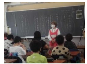
6年生にストーリーテリング