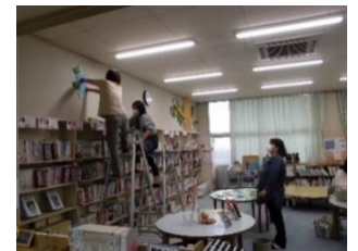
あじさいの花の掲示