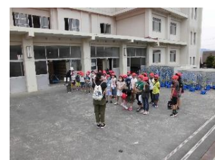
ボランティアの方にお礼のあいさつ