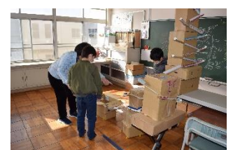
(ピタゴラススイッチ)