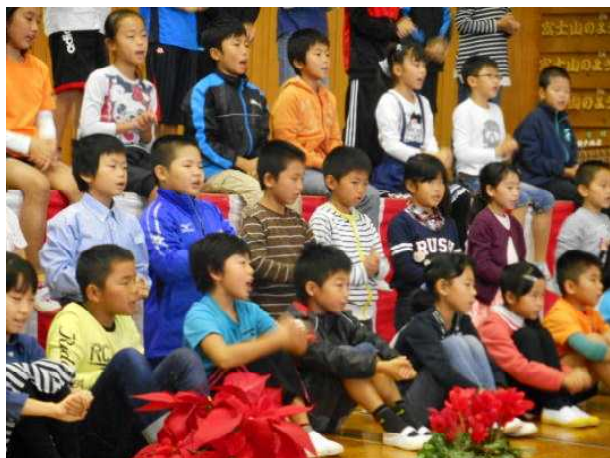
↑ 3・4年生 合唱