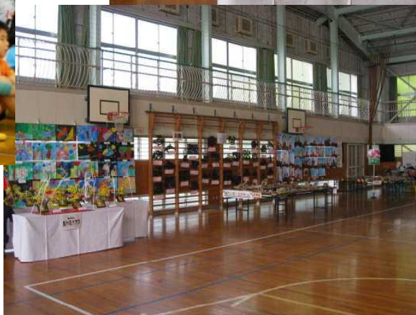
全児童 図工の作品→