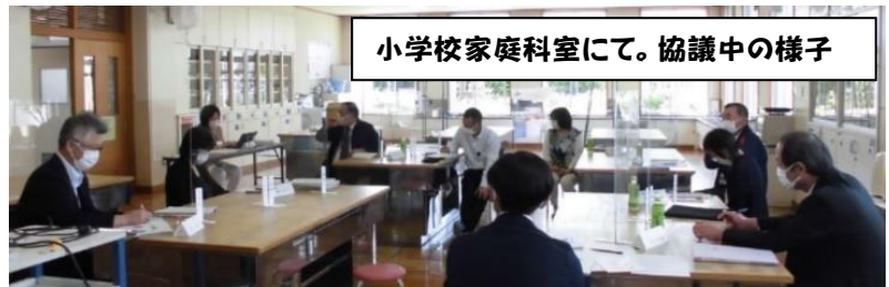
小学校家庭科室にて。協議中の様子

協議会では、まず、全員でコミュニティ・スクールの役割と、富士中央小学校の学校経営方針について再確認しました。次に、富士中央小学校校区の安全について話し合いました。看護学校の北側に、富士中央配水池が建設されることに伴って、配水池の外周に幅員6mの道路が整備されます。北側道路は今まで通り、グリーンベルトが敷かれる予定です。この道路が通学路として適切か、などを話し合いました。また、現在使用している通学路は、5年以上前に決まったものです。子どもの人数も変化してきているので、各地区の皆さんの意見を伺いながら、より安全な通学路に見直す必要があるかもしれない、と意見が出ました。通学路は、子どもがなるべく一人にならず、安全に登下校するためのものです。何かご意見をお持ちの方がいらっしゃいましたら、学校までご連絡ください。