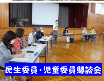
民生委員・児童委員懇談会