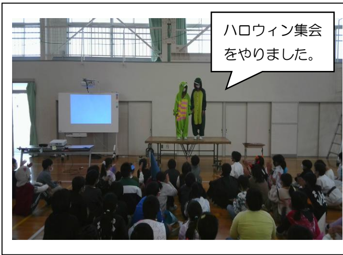
ハロウィン集会 をりました。

※5年生の生活も、残り少なくなってきました。先日25日(金)の帰りに、「6年生の準備を始める会」を学年で行い、登下校中の歩き方やあいさつの仕方などを確認しました。最上級生になる意識を徐々につけていきます。これから、6年生の卒業に向けて、5年生が中心となって行事を動かしていくので楽しみです。