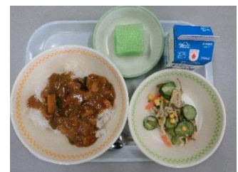
夏野菜カレーサイダーカン