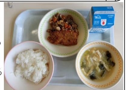
ほきのお茶フライと五目豆