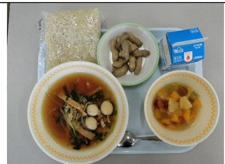
9月「湯で落花生と醤油ラーメン」