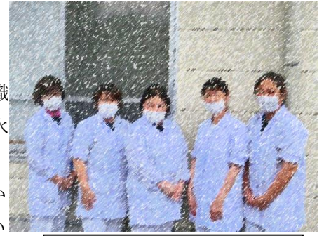
大淵中の調理員さん